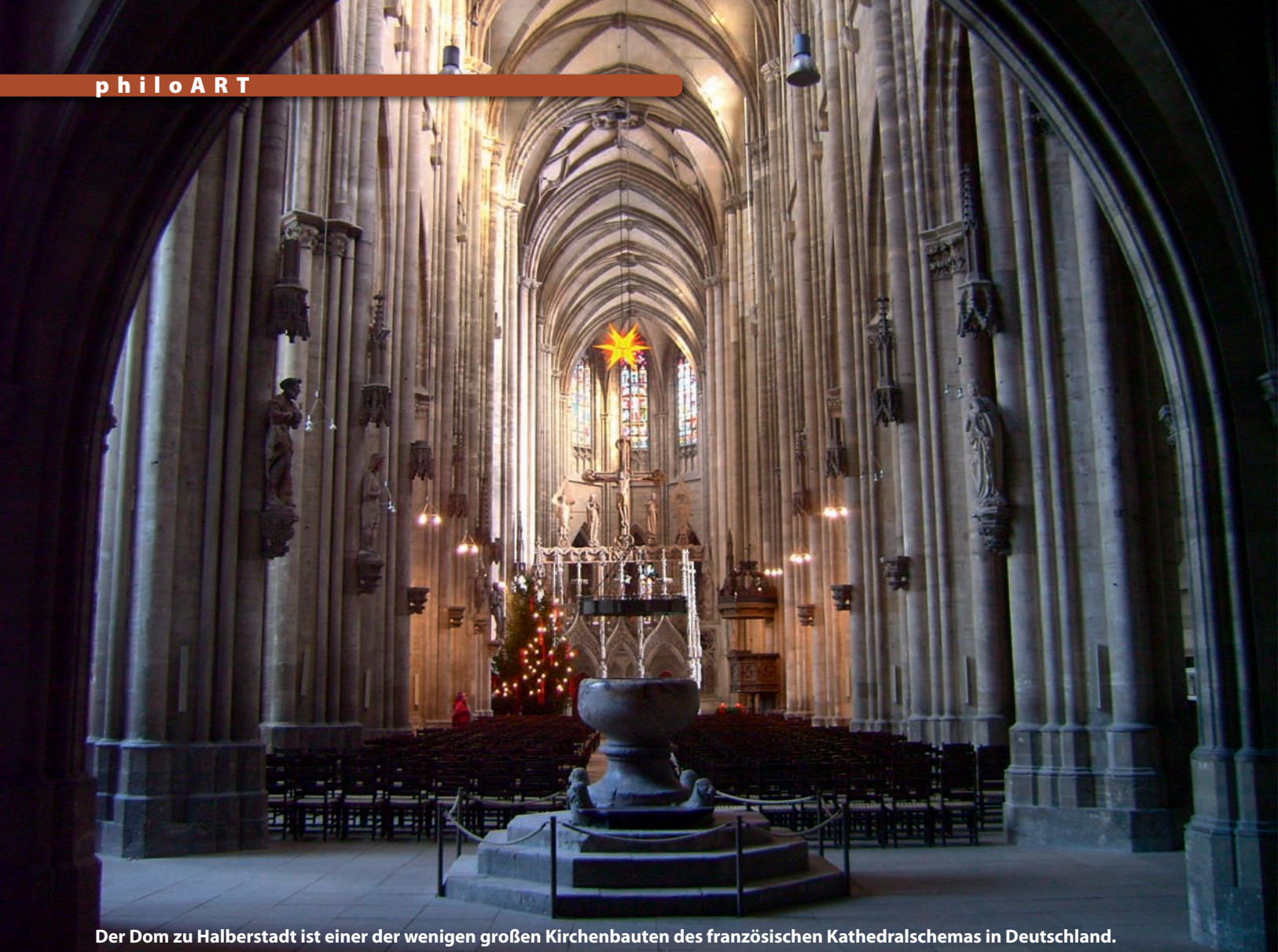
Der Dom zu Halberstadt ist einer der wenigen großen Kirchenbauten des französischen Kathedralschemas in Deutschland.

K aum hatte man in anderen Ländern begonnen, die romanischen Kirchen zu perfektionieren, als in Frankreich ein völlig neuer Stil des Kirchenbaues entstand. Die gotische Kathedrale, die keine Fortsetzung der romanischen Baukunst darstellt, sondern eine vollkommen neue Idee verwirklicht. Getragen von Stützen anstelle von starken Wänden, trägt sie Glas statt Mauerwerk. Glas, sehr viel Glas, um den Tempel transparent zu machen für die göttliche Weisheit. So wird die Kathedrale selbst zu einem Lichtstrahl, der das finstere Mittelalter zu erhel- len verstand.