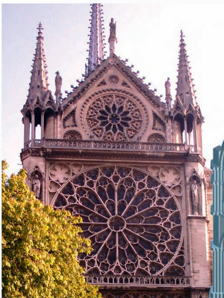
Großflächige Fenster und filigrane Ornamentik: Südseite der Notre Dame de Paris mit Rosette

Die Kunst der Glasmaler war äußerst komplex und hat mit naiver Malerei rein gar nichts zu tun. Sie basierte auf Forschungen zu den Gesetzen der Optik mit