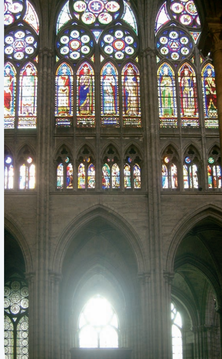
Durch das Triforium und den Lichtgaden einfallendes Licht (Kathedrale von Chartres).

Zweimal im Jahr, und zwar jeweils zu den Tag- und Nachtgleichen im Frühling und im Herbst, wird die Passion am Giebel der Kanzel des Straßburger Doms für ungefähr 20 Minuten von einem grünen Lichtstrahl erhellt. Das Sonnenlicht wird durch eine besonders bearbeitete Glasscheibe, die sich im Fenster an der Südseite des Quer-