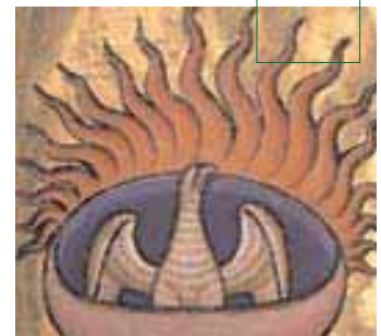
Wie ein Phönix aus der Asche ...