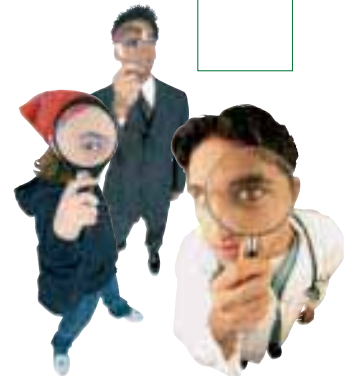
Meine Welt, deine Welt, seine Welt ...