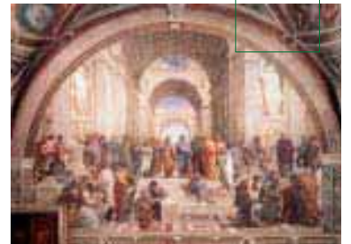
Ein Bild erzählt ...