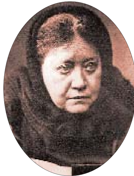
Okkultisten wie H. P. Blavatsky (1831-1891) führen den Ursprung der Tarotkarten auf die Mysterien des versunkenen Kontinentes Atlantis zurück

Obwohl man bei oberflächlicher Betrachtung annehmen könnte, dass die Reihenfolge dieser Trümpfe zufällig sei, ist in Wahrheit das Gegenteil der Fall. Es besteht eine Ordnung in der Abfolge der Trümpfe, die dem Gesetz der Entfaltung und Entwicklung gehorcht und in seiner symbolischen Sprache direkt mit der Struktur des Sonnensystems, mit der Evolution des Bewusstseins, ja mit dem Leben in der Schöpfung selbst in Beziehung steht und eine parallele Symbolik zur Aussage des kabbalistischen Lebensbaumes darstellt.