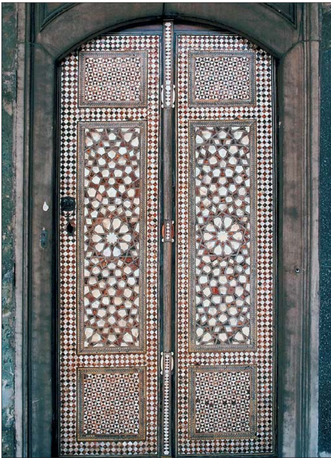
Das Portal als „logisches Universum“