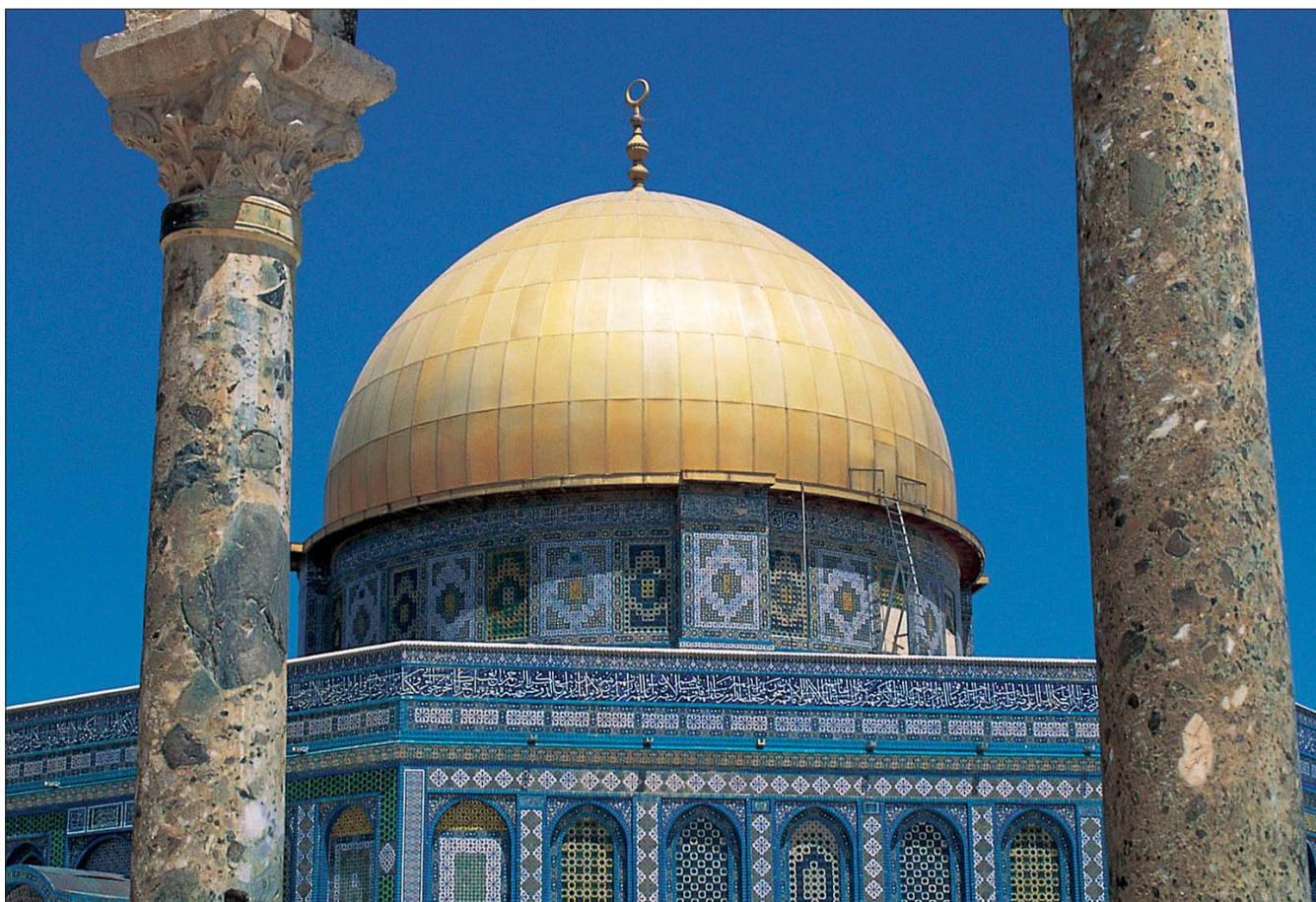
Die Kuppel als Symbol des Himmelsgewölbes, der geistigen Welt

werden. Für ein ungeübtes Auge ist es schwer zu erkennen, aber eine Moschee besteht in ihren Grundbausteinen aus einem Kreis - der Kuppel - und einem Rechteck, dem Raumpörper. Meistens ist er kein perfektes Quadrat, das würde zu „statisch“ wirken. Natürlich stellt das Quadrat die materielle Welt und die Kuppel das „Himmelsgewölbe“, die geistige Welt, dar. Die eigentliche Frage ist aber: Wie verbinde ich die beiden? Wie verbinde ich Himmel und Erde, weltliches und geistiges Leben, Kuppel und Quadrat?