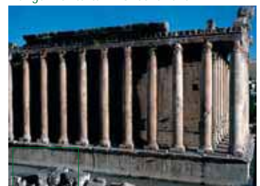
Heilige Architektur in Griechenland