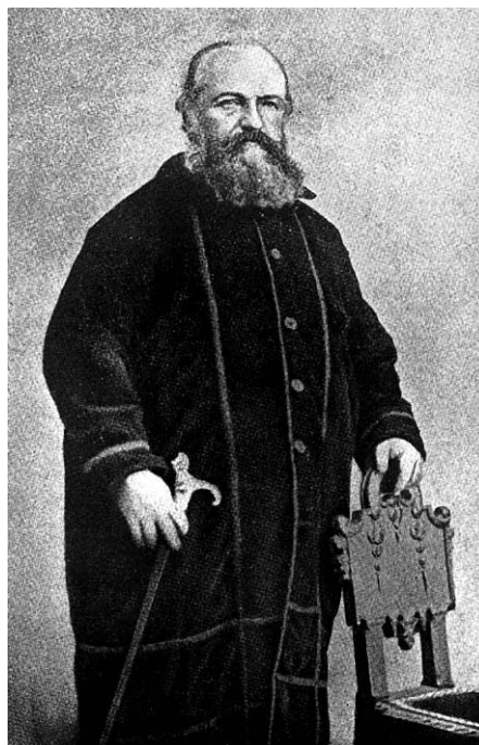
Eliphas Lévi (1810 - 1875)

merken. Außerdem benötigen wir ein hohes Maß an Bescheidenheit, denn wenn sich die ersten Erfolge einstellen, wenn man ein Stück über die allgemeine Unwissenheit hinauswächst, beginnt man auf andere herabzublicken und meint, alles beurteilen zu können.