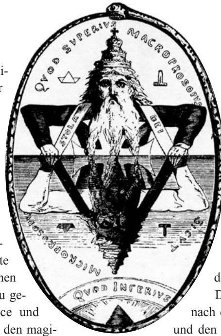
Die 2 Dreiecke der Magie

Doch unsere hoch technisierte Wissenschaft vermag viele Krankheiten nicht zu heilen, die Menschheit nicht zu ernähren, die Kriege nicht zu verhindern, nicht einmal große Erdbeben vorherzusagen, was beispielsweise den alten Chinesen vor tausenden Jahren gelang. Was wissen wir al-